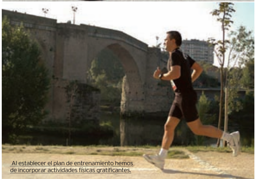
Al establecer el plan de entrenamiento hemos de incorporar actividades físicas gratificantes.